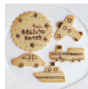
乗り物セット 1セット 500円 (540税込)