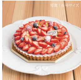
ストロベリーデコレーション

4号 (2-3名) 1959円 (2115税込) 5号 (4-6名) 2708円 (2924税込) 6号 (7-8名) 3788円 (4091税込)