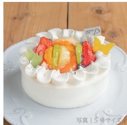
平飼有精卵 (海の街たまご) とフルーツのプレミアムショート

3号 (1-2名) 1304円 (1408税込) 4号 (3-4名) 2414円 (2607税込) 5号 (4-6名) 3700円 (3996税込) 6号 (7-8名) 5000円 (5400税込) 7号 (9-10名) 6600円 (7128税込) ※全サイズ前々日までにご予約ください