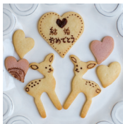
動物セット 1セット 500円 (540税込)