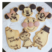
キャラクター 1個 300円 (324税込)