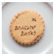
クッキーネームプレート 1個 150円 (162税込)

※単品販売はございませんのでホールケーキと一緒にご注文ください。手作りのためサイズ・デザインは写真と多少異なる場合がございます。1週間前までのご注文をおすすめします。また、ケーキの種類やサイズによってはクッキーデコレーションがのりきらないことがあります。その場合は別添えでお渡しし、お客様ご自身でケーキにのせていただきます。別添えクッキーは簡易包装となりますので、ケーキと一緒ににお早めにお申し込みください。