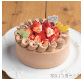
平飼有精卵 (海の街たまご) と道産苺のプレミアムショート・チョコ

3号 (1-2名) 1203円 (1299税込) 4号 (3-4名) 2314円 (2499税込) 5号 (4-6名) 3400円 (3672税込) 6号 (7-8名) 4600円 (4968税込) 7号 (9-10名) 5900円 (6372税込)