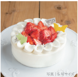
平飼有精卵 (海の街たまご) と道産苺のプレミアムショート

3号 (1-2名) 1203円 (1299税込) 4号 (3-4名) 2314円 (2499税込) 5号 (4-6名) 3400円 (3672税込) 6号 (7-8名) 4600円 (4968税込) 7号 (9-10名) 5900円 (6372税込)