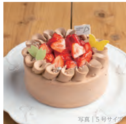
平飼有精卵 (海の街たまご) と道産苺のプレミアムショート・チョコ

3号 (1-2名) 1316円 (1421税込) 4号 (3-4名) 2479円 (2677税込) 5号 (4-6名) 3658円 (3950税込) 6号 (7-8名) 4994円 (5393税込) 7号 (9-10名) 6455円 (6971税込)