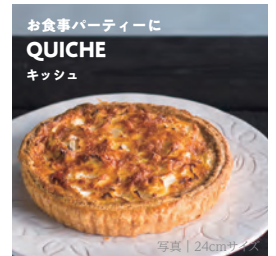
お食事パーティーにぴったりホールキッシュ

季節限定キッシュもお選びいただけます。ホールまたはハーフ&ハーフ24cm (~10名) 4000円前後