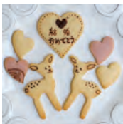
動物セット 1セット 500円 (540税込)