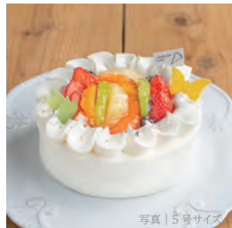
平飼有精卵 (海の街たまご) とフルーツのプレミアムショート

3号 (1-2名) 1417円 (1530税込) 4号 (3-4名) 2579円 (2785税込) 5号 (4-6名) 3958円 (4274税込) 6号 (7-8名) 5394円 (5825税込) 7号 (9-10名) 7155円 (7727税込)