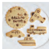
乗り物セット 1セット 500円 (540税込)