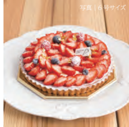
ストロベリーデコレーション

4号 (2-3名) 2199円 (2374税込) 5号 (4-6名) 3028円 (3270税込) 6号 (7-8名) 4188円 (4523税込)