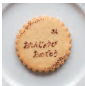
クッキーネームプレート 1個 150円 (162税込)

※単品販売はございませんのでホールケーキと一緒にご注文ください。手作りのためサイズ・デザインは写真と多少異なる場合がございます。1週間前までのご注文をおすすめします。また、ケーキの種類やサイズによってはクッキーデコレーションのりきらないことがあります。その場合は別添えでお渡しし、お客様ご自身でケーキにのせていただきます。別添えクッキーは簡易包装となりますので、ケーキと一緒に早めめにし上がりください。