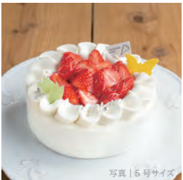
平飼有精卵 (海の街たまご) と道産苺のプレミアムショート

3号 (1-2名) 1316円 (1421税込) 4号 (3-4名) 2479円 (2677税込) 5号 (4-6名) 3658円 (3950税込) 6号 (7-8名) 4994円 (5393税込) 7号 (9-10名) 6455円 (6971税込)