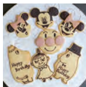
キャラクター 1個 300円 (324税込)